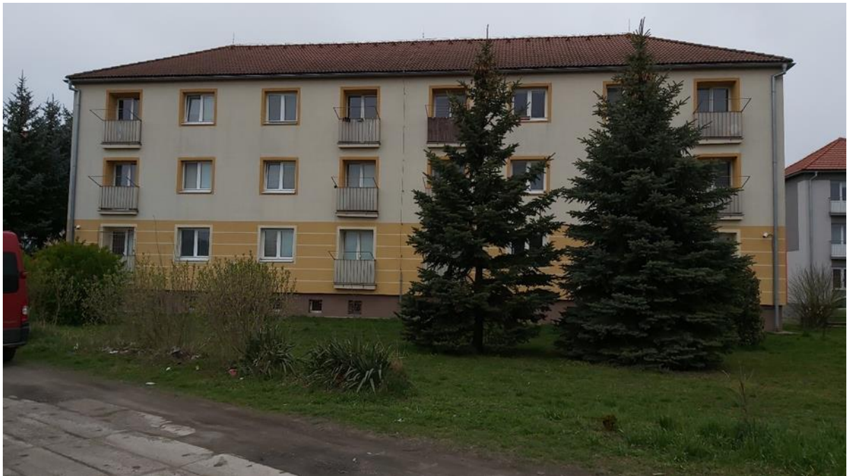
Príloha č. 2