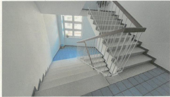
Vnútorne priestory BD.jpg