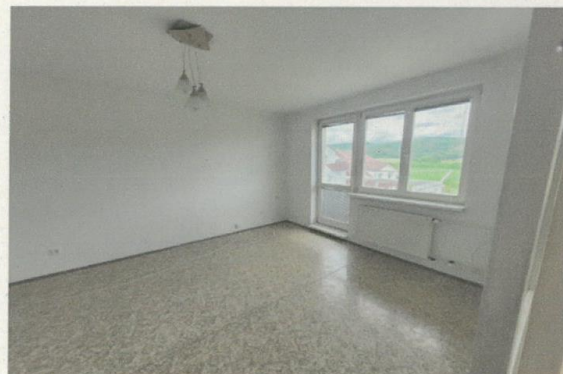
Izba s balkónom.jpg