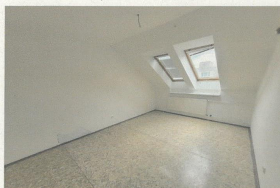
Obytná izba II. .jpg